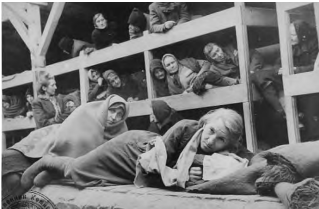
9. Вскоре после освобождения Освенцима советскими войсками: женщины, пережившие заключение в лагере, прижимаются друг к другу в бараках. Освенцим, 1945 г.