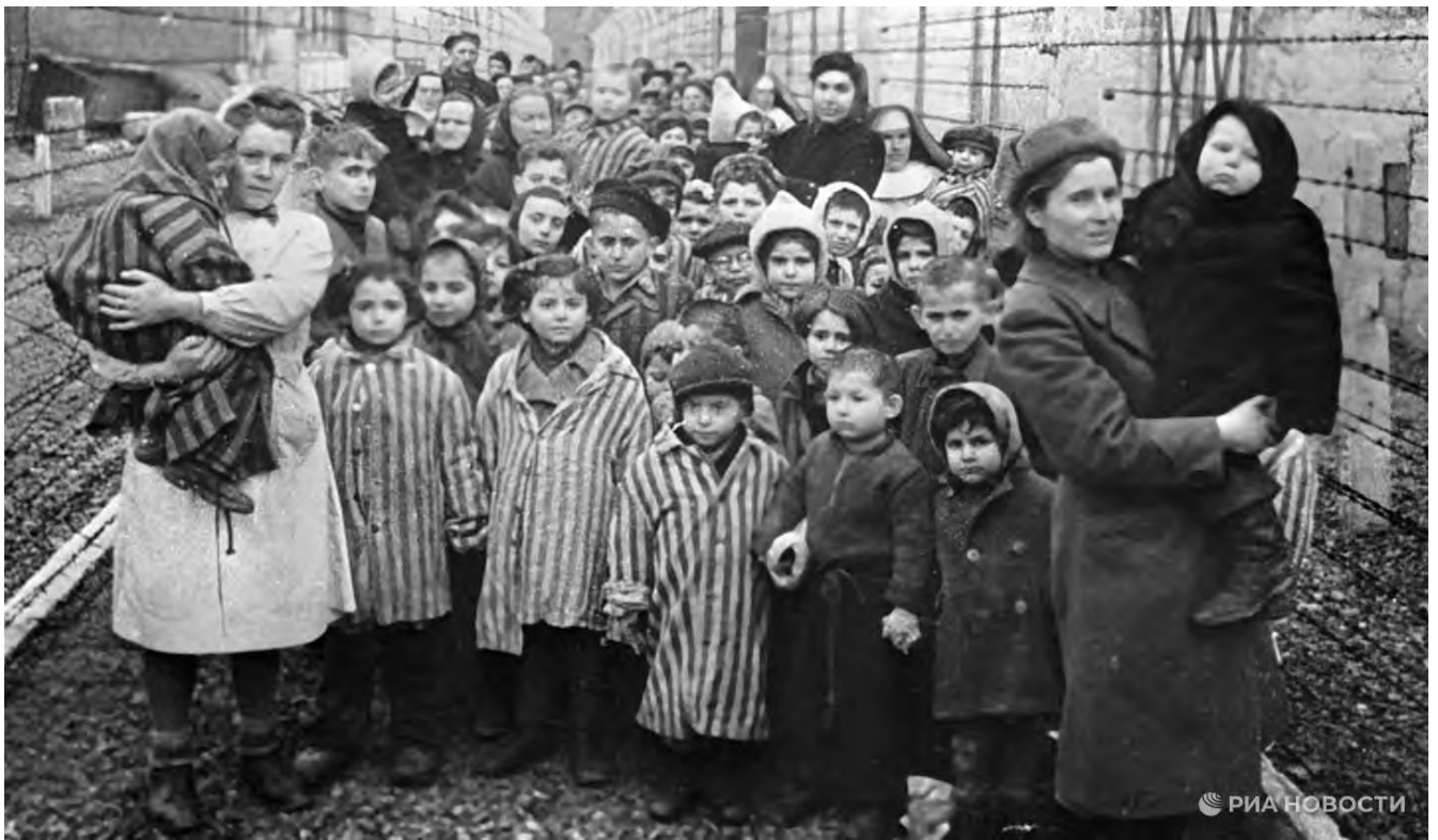
Группа детей, освобожденных из концлагеря Освенцим, февраль 1945 г.

Вопросы. Дети были самыми беззащитными узниками концентрационного лагеря «Освенцим». Они находились в ещё большей опасности, чем взрослые. Многие из них были вашими ровесниками, и даже младше.