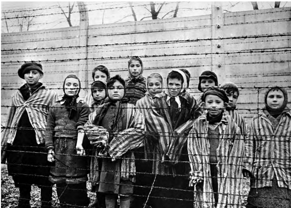
Освобожденные дети Освенцима, январь 1945 г.

Эти вещи нацисты планировали использовать в своих целях после убийства их обладателей, можно ли сказать, что убитых людей ограбили?