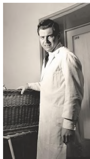
6. Врач-садист Йозеф Менгеле, проводивший медицинские опыты на узниках концлагеря Освенцим, более известный под прозвищем «Ангел смерти», дата неизвестна