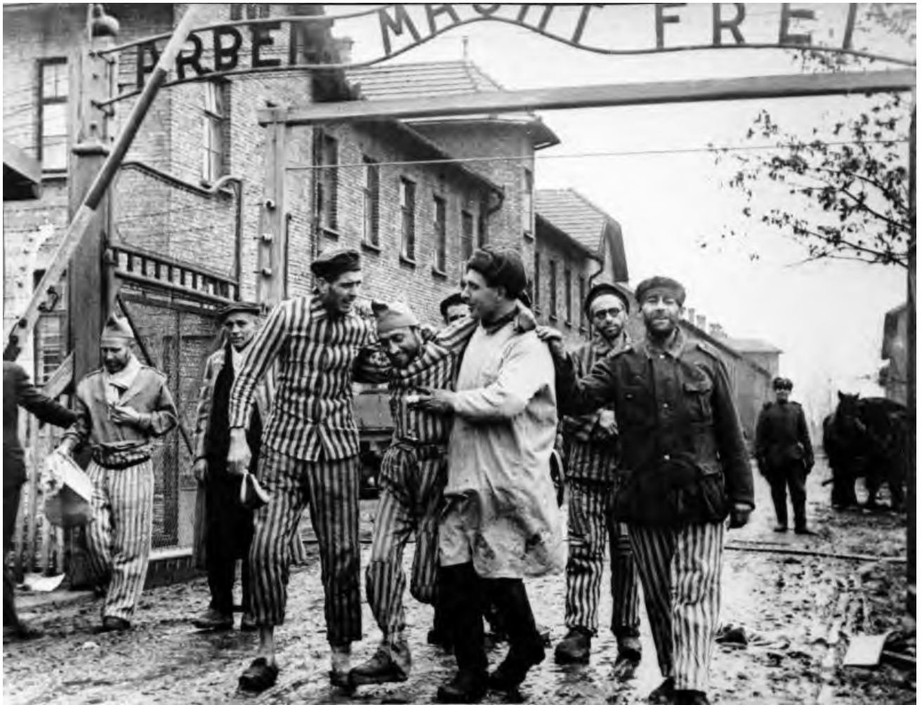
Освобожденных узников концлагеря Освенцим выводят из лагеря, февраль 1945 г.

Вопросы. Но и концентрационному лагерю «Освенцим» пришёл конец 27 января 1945 года. Ровно 80 лет назад войска Советского Союза освободили узников «Освенцима». Выжившие узники стали свободными.