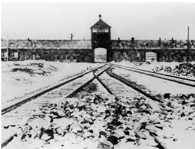
3. Железнодорожные пути, ведущие в концлагерь Освенцим, февраль 1945 г.