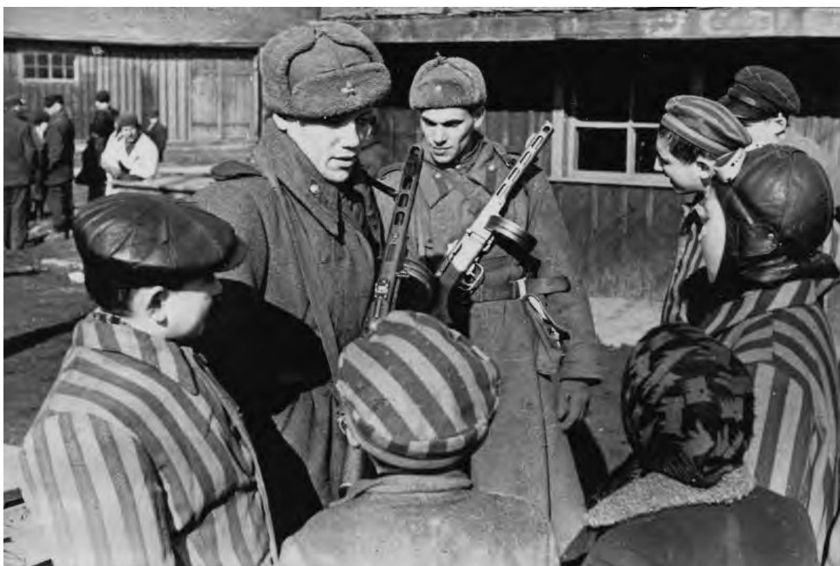
Советские солдаты общаются с детьми, освобожденными из Освенцима, январь 1945 г.