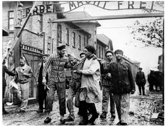
8. Освобожденных узников концлагеря Освенцим выводят из лагеря, февраль 1945 г.