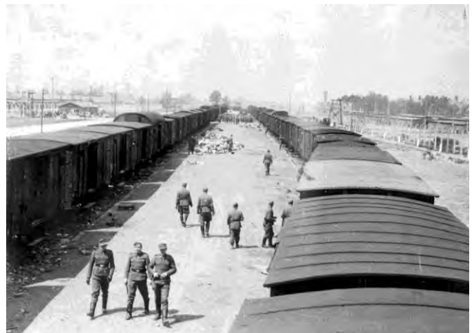
12. Платформа концентрационного лагеря Освенцим. Сбор вещей, отобранных у узников, отправленных в лагерь, дата неизвестна