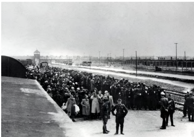
1. Привезенные евреи из Венгрии выстраиваются для селекции в концлагере Освенцим, май 1944 г. (На заднем фоне видны ворота лагеря)