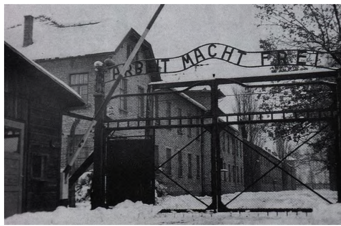
14. Главные ворота концлагеря Освенцим, дата неизвестна