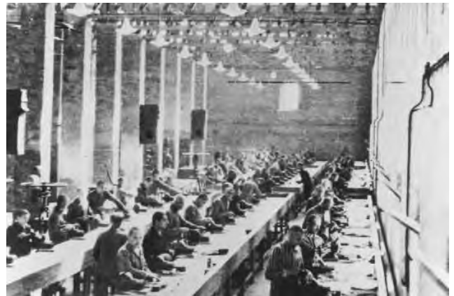
10. Заключение на принудительных работах на заводе «Сименс». Освенцим, 1940–1944 гг.