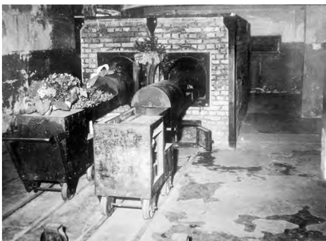
5. Крематорий в концентрационном лагере Освенцим, 1945 г.