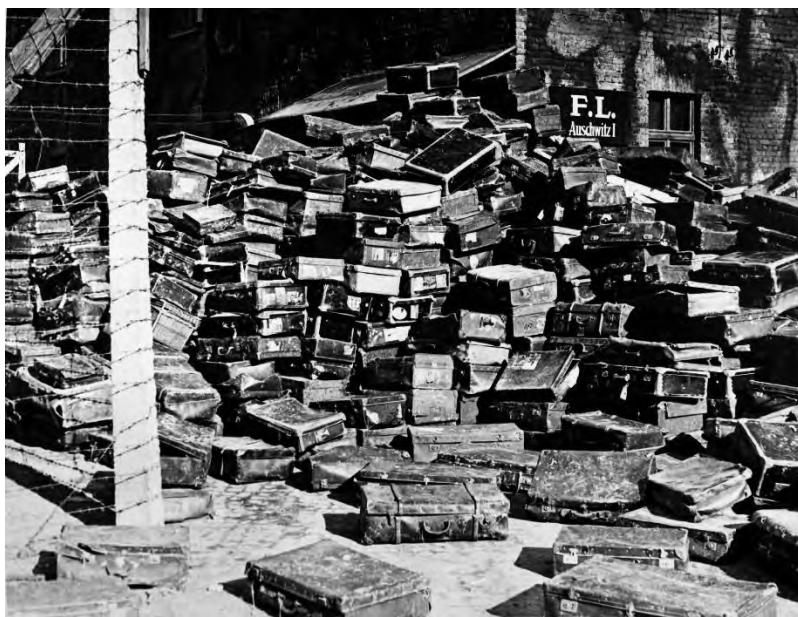
Чемоданы бывших узников нацистского концентрационного лагеря смерти Освенцим (Аушвиц) с маркировками всех стран Европы, 27 января 1945 г.

Вопросы. На фотографиях представлено множество личных вещей: тысячи очков и сотни чемоданов, сваленных на земле в огромные кучи, это выглядит очень странно. Люди, у которых есть проблемы со зрением, носят очки. Они не расстаются с ними, это личная вещь, без которой им очень тяжело жить. Чемодан тоже личная вещь, люди используют ее для перевозки и хранения личных вещей, без него путешественник чувствует себя очень некомфортно.