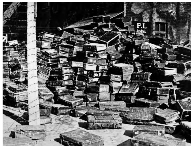
4. Чемоданы бывших узников нацистского концентрационного лагеря Освенцим с маркировками всех стран Европы, 27 января 1945 г.