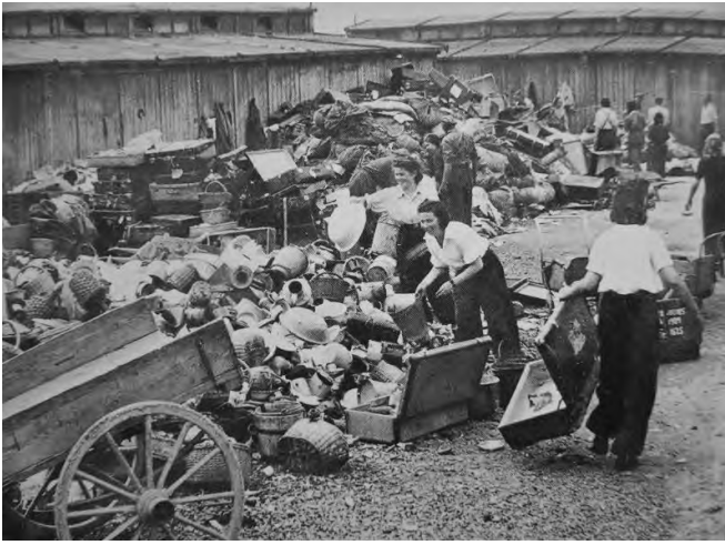
7. Сортировка вещей евреев, доставленных в концлагерь Освенцим, май 1944 г.