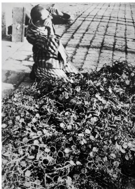
Бывший узник концлагеря Освенцим подбирает себе очки, 1945 г.

Ниже представлены исторические источники, которые могут быть использованы вами для подготовки памятных мероприятий, посвящённых 80-летию со дня освобождения концентрационного лагеря Освенцим, а также вопросы и задания к ним. Исторические источники представлены в соответствии с познавательным и психологическим уровнем обучающихся и организованы по уровням образования.