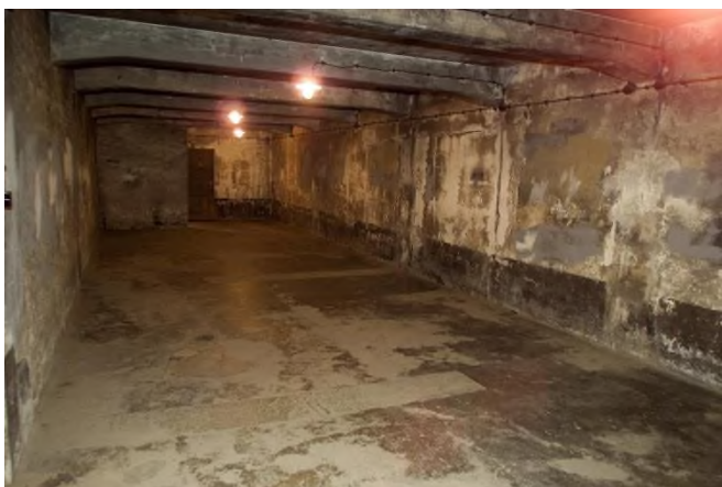
13. Газовая камера в концентрационном лагере Освенцим. Наши дни