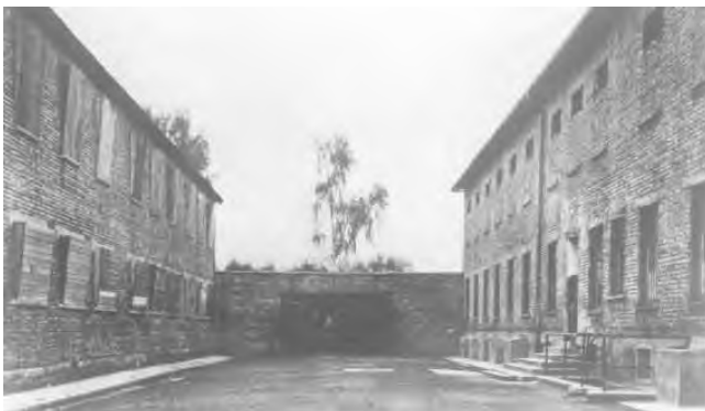
11. «Черная стена» между блоком 10 (слева) и блоком 11 (справа) в концентрационном лагере Освенцим, где производились казни заключенных, дата неизвестна