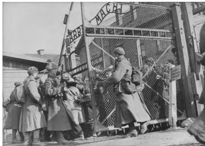
2. Советские солдаты открывают ворота концлагеря Освенцим, освобождая заключенных, 27 января 1945 г.