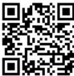
Рисунок 6 — Рекомендации по проведению кинопоказов в профилактике

Среди фильмов по тематике противодействия терроризму можно использовать следующие фильмы: «Беслан. Память» (Россия, 2014 г., возрастное ограничение: 12+), «Кавказский пленник» (Россия, 1996 г., возрастное ограничение: 18+), «Я не террорист» (Узбекистан, 2021 г., возрастное ограничение: 18+), «Отель Мумбаи: противостояние» (США, Австралия, 2018 г., возрастное ограничение: 18+) и т.д.