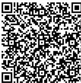
Рисунок 7 — Сценарий тематической викторины с примерами вопросов

Несмотря на игровой формат, ключевая цель мероприятия – профилактическая. Поэтому особый акцент стоит сделать именно на объявлении правильных ответов, поясняя их и отвечая на все возникающие вопросы (см. рисунок 7).