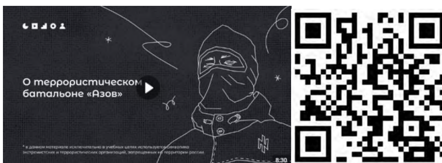
Рисунок 2 – Видеоролик, разъясняющий причины признания организации террористической

4) структурное подразделение Минобороны Украины легион «Свобода России» (признан террористической организацией по решению Верховного Суда Российской Федерации от 16.03.2023 г. № АКПИ23-101С). Цель организации заключается в подрыве государственности, территориальной целостности и конституционных основ нашей страны. Немалая часть боевиков указанных военизированных формирований является праворадикалами и неонацистами по своим идеологическим убеждениям. Опасность данных организаций заключается, с одной стороны, в соучастии в убийстве российских военнослужащих в зоне СВО, с другой стороны, в попытках вовлечения российской молодежи в противоправную деятельность: поджоги военных комиссариатов, нападения на правоохранительные органы, совершение диверсий, а также финансирование украинских вооруженных сил (ВСУ) (см. рисунок 3).