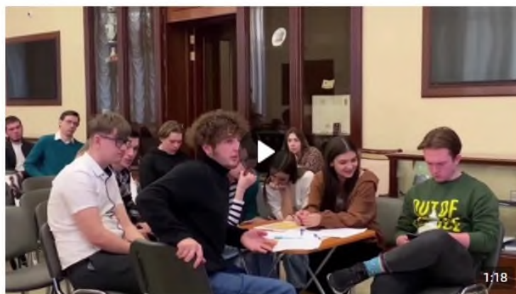
Дебаты «Идеология радикальных организаций» 1 888 просмотров

В рамках дебатов можно: развенчивать мифы, декларируемые представителями радикальных идеологий для вербовки; развивать навыки критического мышления и ведения дискуссии; формировать в целом антитеррористическое сознание и активную гражданскую позицию. Рекомендуется для мероприятия вовлекать не более 20 человек (см. рисунок 5).