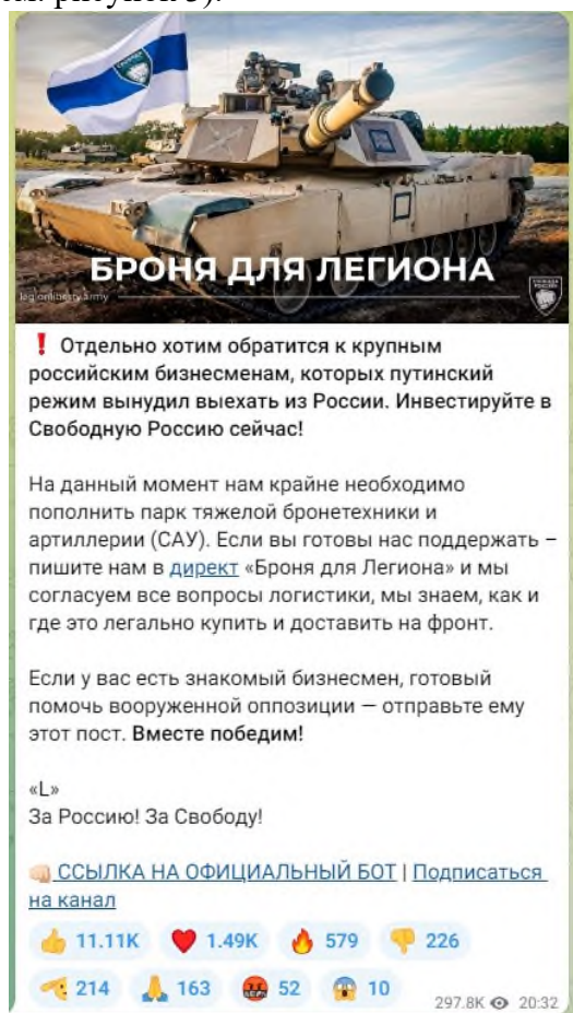
Рисунок 3 — Скриншот телеграм-канала легиона «Свобода России» с призывом к финансированию

4) структурное подразделение Минобороны Украины легион «Свобода России» (признан террористической организацией по решению Верховного Суда Российской Федерации от 16.03.2023 г. № АКПИ23-101С). Цель организации заключается в подрыве государственности, территориальной целостности и конституционных основ нашей страны. Немалая часть боевиков указанных военизированных формирований является праворадикалами и неонацистами по своим идеологическим убеждениям. Опасность данных организаций заключается, с одной стороны, в соучастии в убийстве российских военнослужащих в зоне СВО, с другой стороны, в попытках вовлечения российской молодежи в противоправную деятельность: поджоги военных комиссариатов, нападения на правоохранительные органы, совершение диверсий, а также финансирование украинских вооруженных сил (ВСУ) (см. рисунок 3).