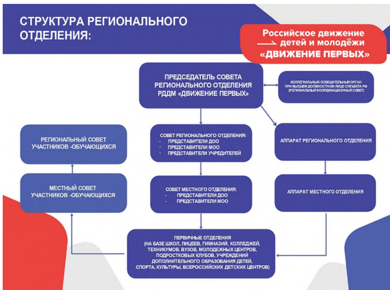
Рис. 2. Организационная структура Движения Первых

Единоличным исполнительным органом регионального отделения Движения является председатель совета регионального отделения Движения, назначаемый и освобождаемый от должности Координационным советом Движения. Срок полномочий председателя совета регионального отделения Движения составляет 3 года.