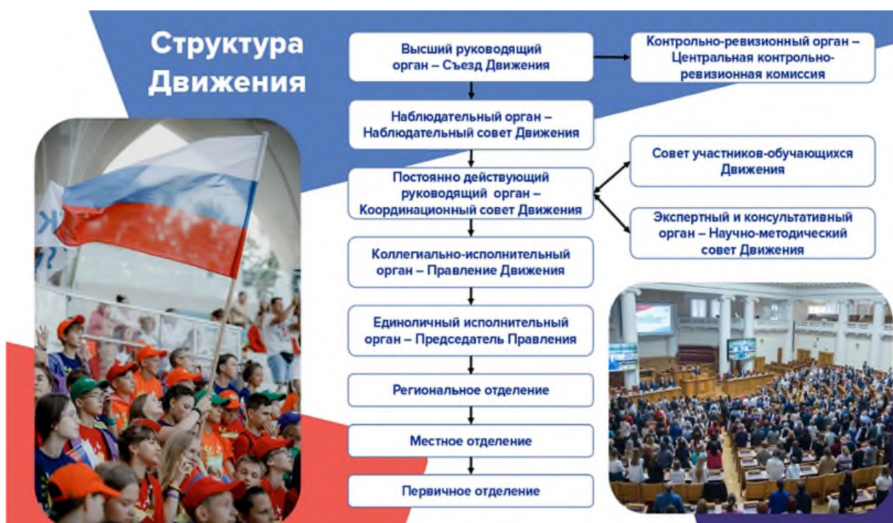
Рис. 1. Структура и центральные органы управления Движения Первых