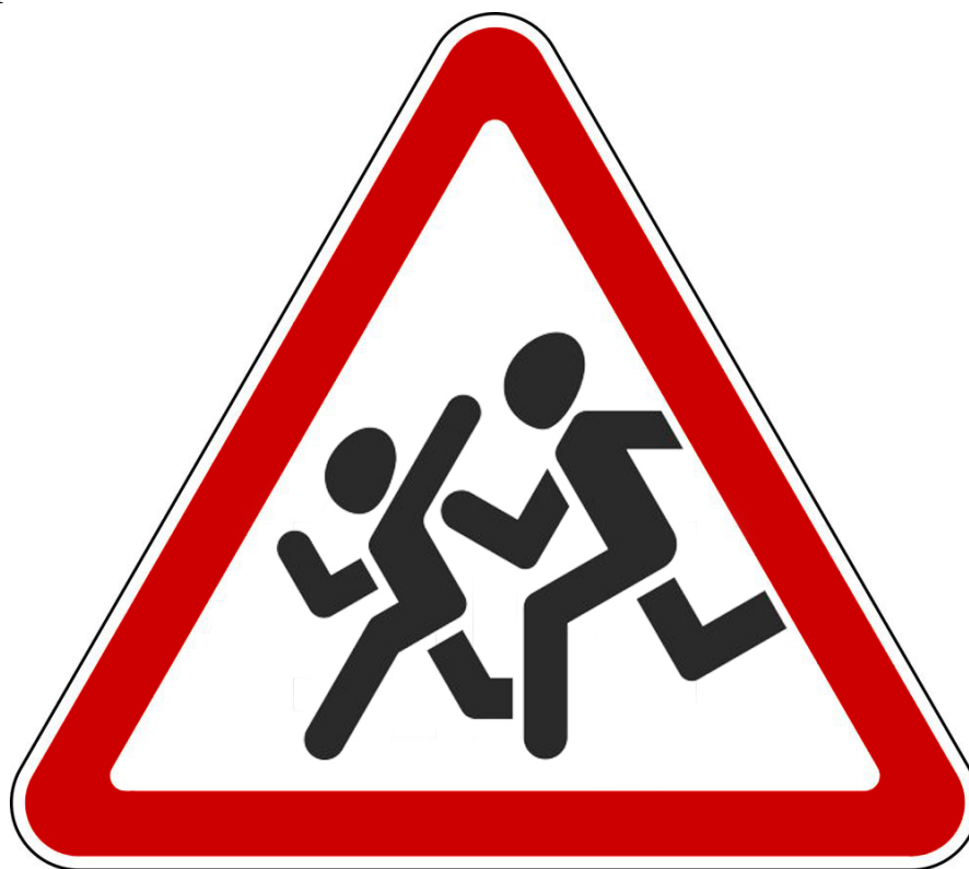
Дорожный знак «Дети»